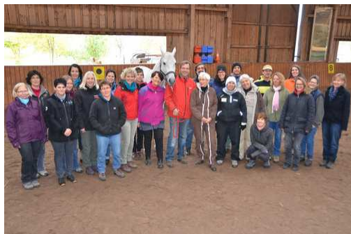
Séminaire Européen à Teningen en Allemagne novembre 2015