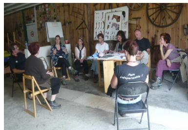
Bonnay – juillet 2014