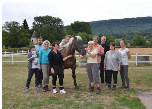
Séminaire Européen à Bonnay – Juillet 2015