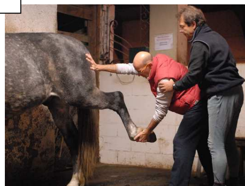
Résidentiel praticien Européen en Alsace – novembre 2009